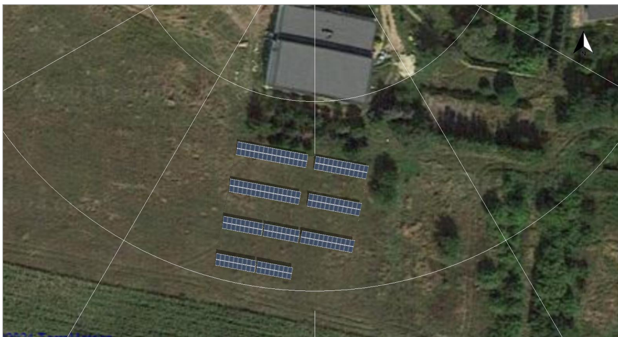
Ilustracja: Zrzut ekranu03