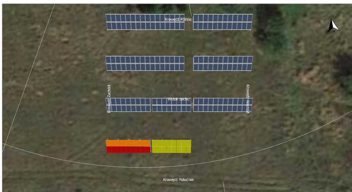
Ilustracja: Zrzut ekranu01