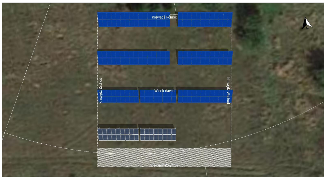
Ilustracja: Zrzut ekranu02